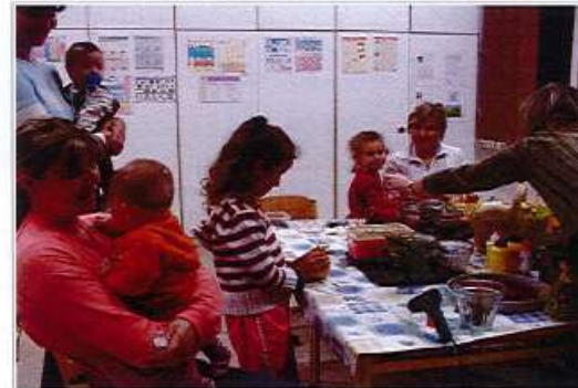
trocha historie - Halloween ve škole 2008