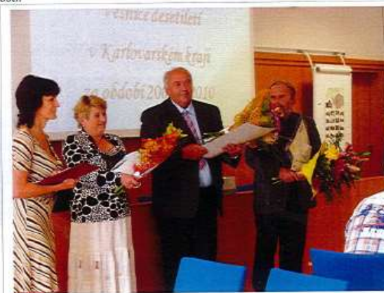
Zleva : tisková mluvčí krajského úřadu, starostka Tří Seker, starosta Lomnice (2.místo), starosta Merklína (1.místo)