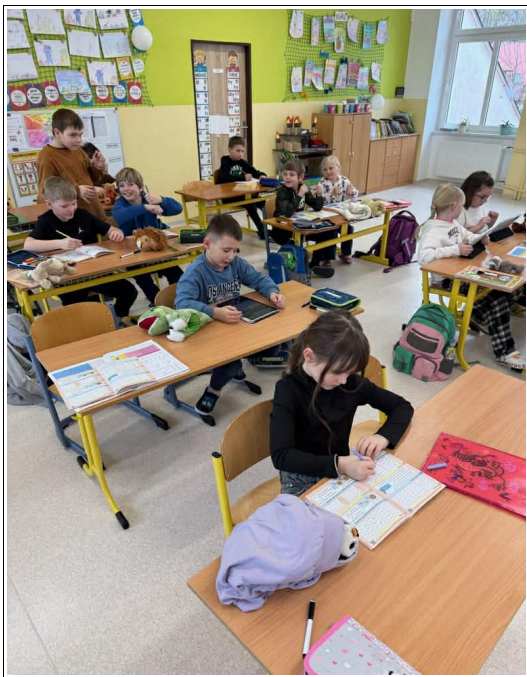
Na fotografii :rozšířená učebna

V rozpočtu roku 2025 bylo počítáno s přístavbou tělocvičny ke školní budově. Bohužel, projektové práce se velmi protahovaly a teprve teď bude možné požádat o stavební povolení. Také v rekonstrukci budovy bývalé fary se nijak nepokročilo. Určitě je neúspěchů více, ale letos se snad dost plánovaných akcí povede.