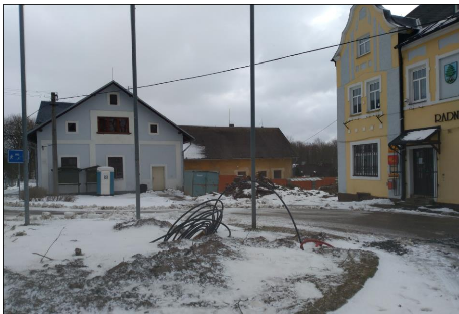
Pohled na prostor před budovou radnice v lednu 2019.

Věřím, že až bude hotovo, bude se nám všem nový prostor u radnice líbit.