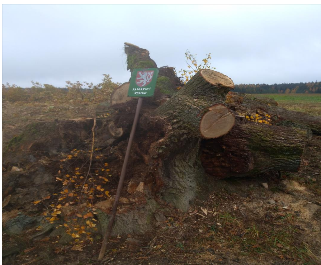
Foto: Dagmar Strnadová Další fotografie najdete na www.trisekery.cz

V loni v létě se po silném větru zřítily dva mohutné kmeny dubu, který byl vyhlášen památným stromem. Tenhle krásný mnohakmenný strom rostl téměř na konci polní cesty v místě bývalého Štolního mlýna. Po pádu oněch dvou kmenů bylo jasné, že další kmeny mohou také spadnout. Spodní část srostlých kmenů byla částečně ztrouchnivělá a napadená škůdci. Po dohodě s odborem životního prostředí MěÚ Mariánské Lázně odsouhlasilo naše zastupitelstvo finanční spoluúčast na vyvázání a zpevnění koruny ocelovými lany. Měli jsme uhradit polovinu ceny za odborný zásah. Bohužel, než byla práce dokončena, opět silně zafoukalo a vylomily se další kmeny. Jako vztyčený prst odolal větru poslední kmen. Po další konzultaci bylo odborem životního prostředí rozhodnuto o sejmutí ochrany památného stromu a bylo nám doporučeno, aby se pokácelo i poslední torzo. Práce na odklizení dřevní hmoty si vyžádaly téměř tři dny. Silné kmeny jsme nechali odvézt na připravovanou přírodní zahradu pro děti, pata vývratu zůstane na původním místě. O dnes již bývalém památném stromě bude na místě nainstalována informační tabule, na které se návštěvníci dočtou i informace o bývalém Štolním mlýnu. Místo bude upraveno a určitě dojde i na výsadbu nových stromků.