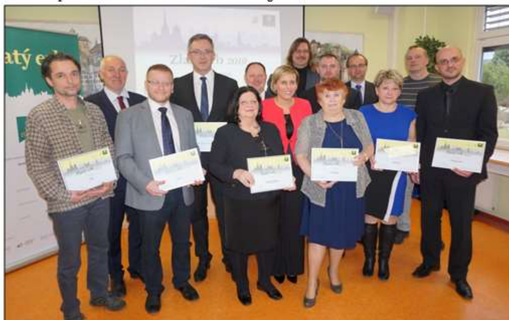
Vítězové jednotlivých kategorií na Krajském úřadě Karlovarského kraje.